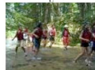
自然学校 プロフィール