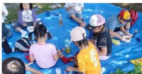
アウトドア 年少版(2)